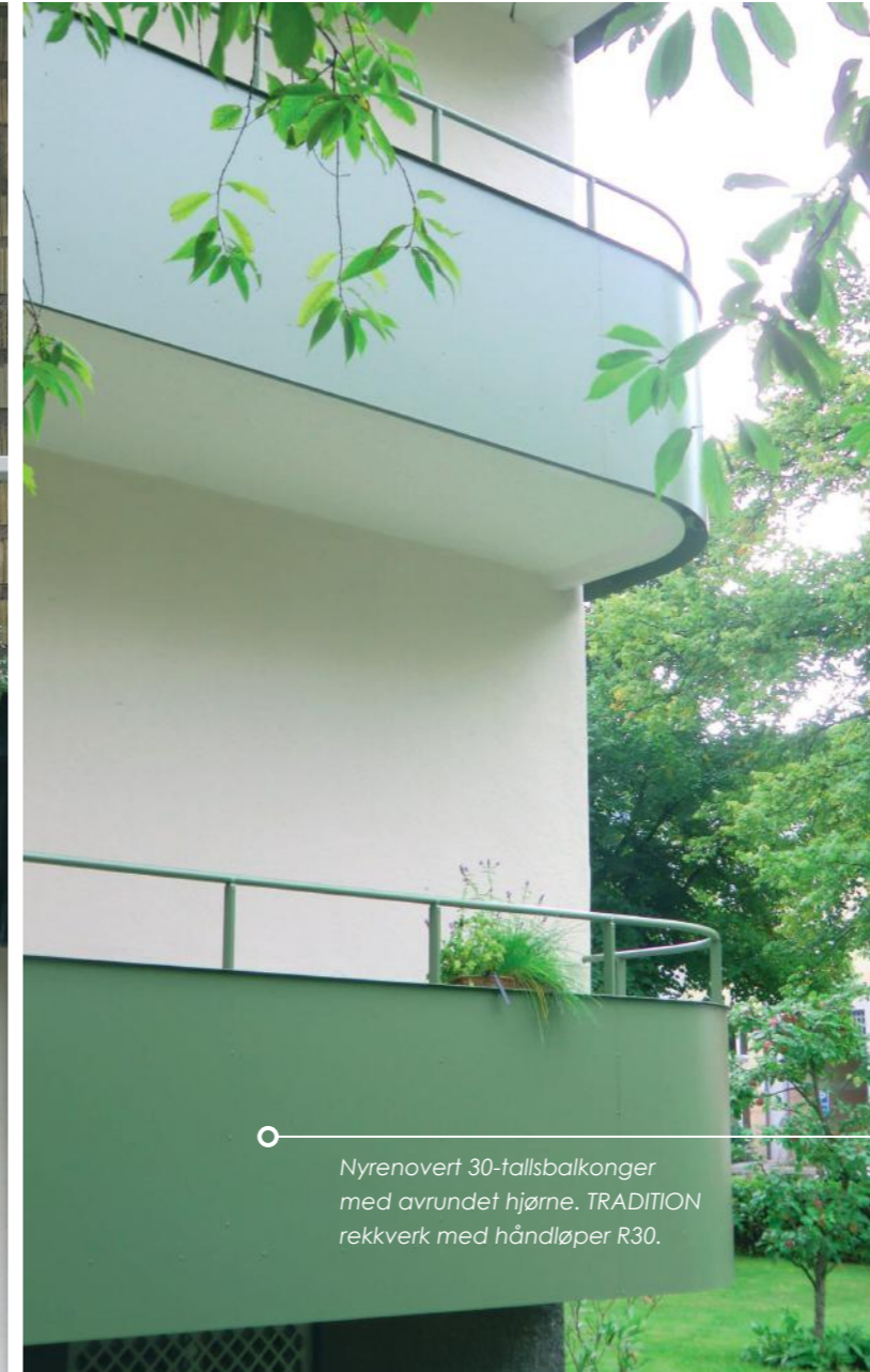
Nyrenovert 30-tallsbalkonger med avrundet hjørne. TRADITION rekkverk med håndløper R30.