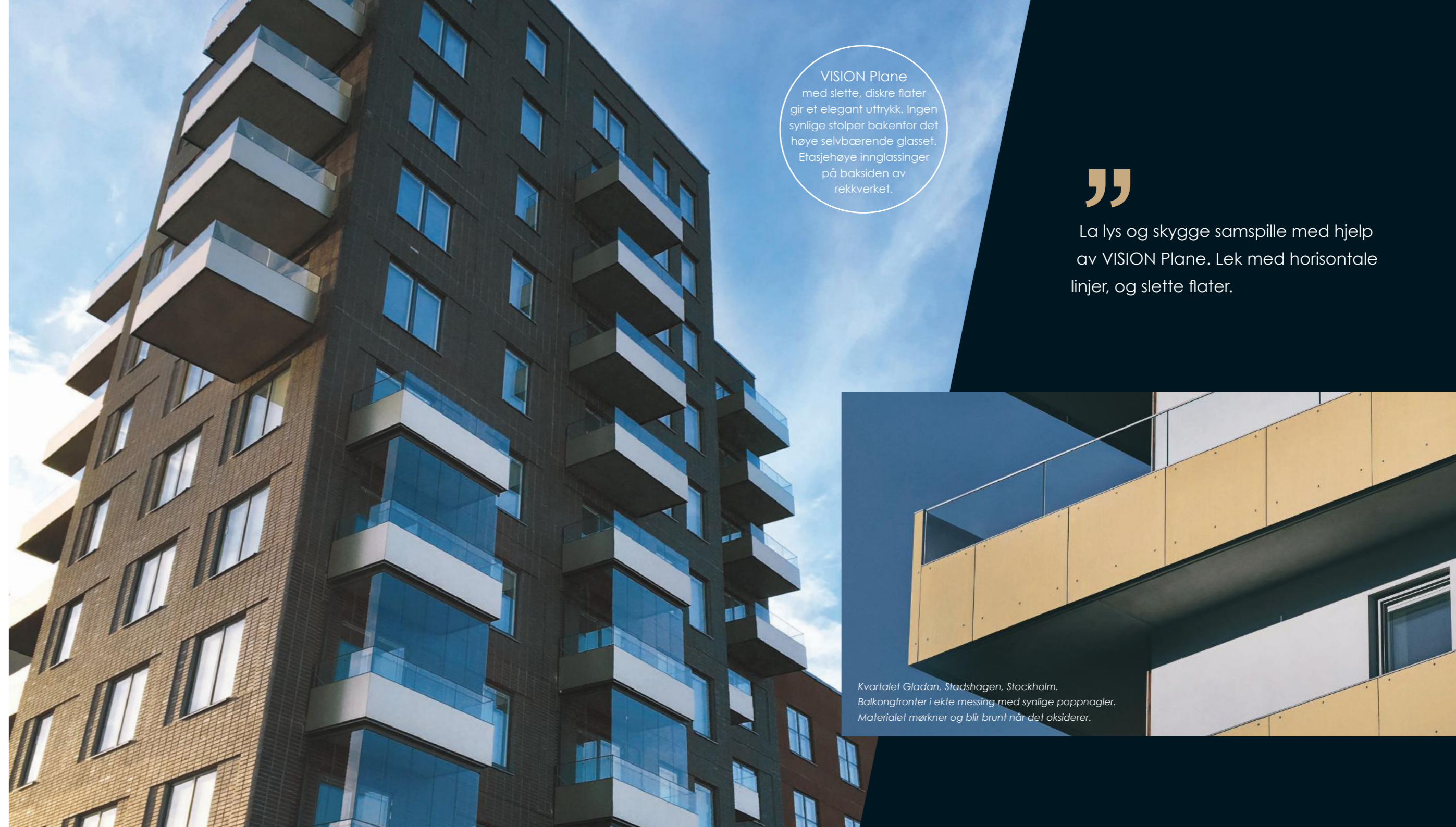
Kvartalet Gladan, Stadshagen, Stockholm. Balkongfronter i ekte messing med synlige poppnagler. Materialet mørkner og blir brunt når det oksiderer.

La lys og skygge samspille med hjelp av VISION Plane. Lek med horisontale linjer, og slette flater.